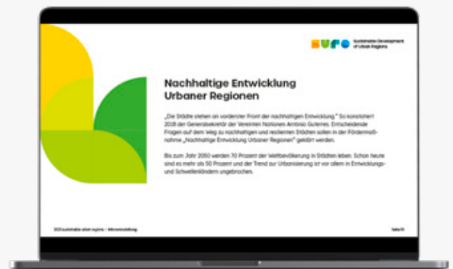
Anwendungsbeispiele Key Visual (Plakat, Lanyard, PowerPoint-Folie)